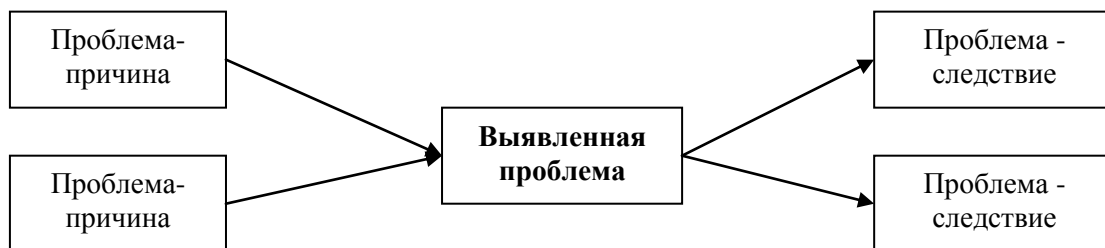
Рис.2.Схема причинно-следственного анализа [5].

От текста рисунок отделяется пропуском строки. Данные в рисунке могут быть представлены шрифтом 10-11 пунктов и одинарным межстрочным интервалом.